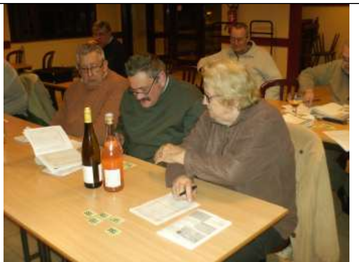
Gains de la tombola..... Trois nouveaux membres fidèles.

Le verre de l'amitié, la réalisation entre membres et la tombola terminent cette assemblée. Des cakes ont agrémenté le verre de l'amitié, merci à nouveau aux épouses pour ces préparations appréciées de tous. La séance est levée vers 22 heures.